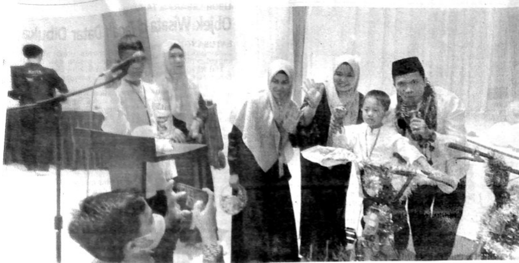
SEPEDA | Salah seorang anak yatim tampak senang mendapat hadiah sepeda saat Yatim Fest ke-3 di Hotel Aulia, Selasa (12/4) petang. (Jasriman)